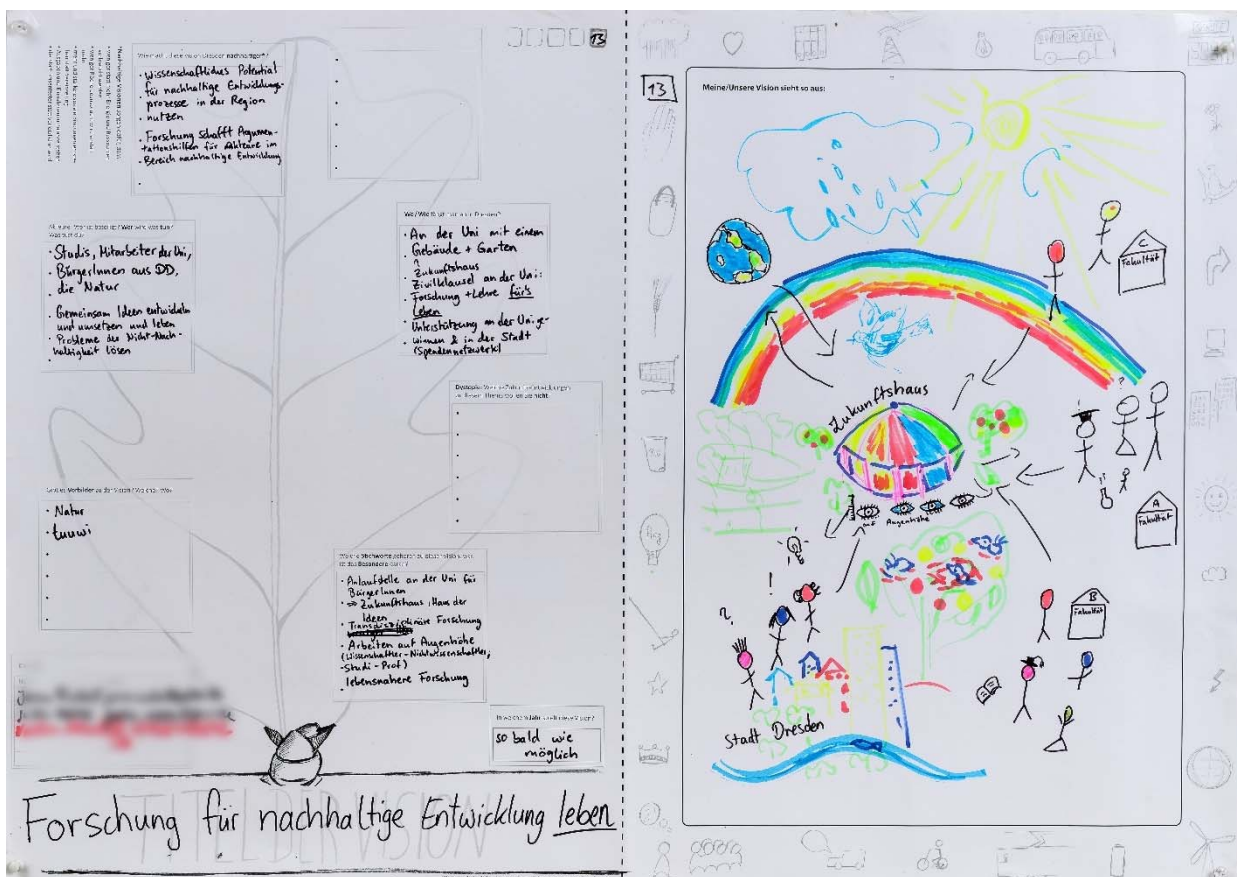
Abbildung 1: Von Bürger/innen bearbeitetes Zukunftsstadt-Arbeitsblatt zur Visionsfindung

Natürlich muss darauf geachtet werden, dass solcherart Beteiligungsverfahren nicht die demokratischen Prozederes untergraben, indem Stadtgestaltung völlig losgelöst von gewählten Räten und bestehenden Rechtsrahmen geschieht – aber davon sind wir in den meisten Städten weit entfernt. Vielmehr stellen Beteiligungsverfahren, die auf Zusammenarbeit setzen, in erster Linie ein enormes Potenzial dar, bei dem Bürger/innen und Verwaltungsmitarbeiter/innen die Chance auf Kooperation und gemeinsame Gestaltung haben.