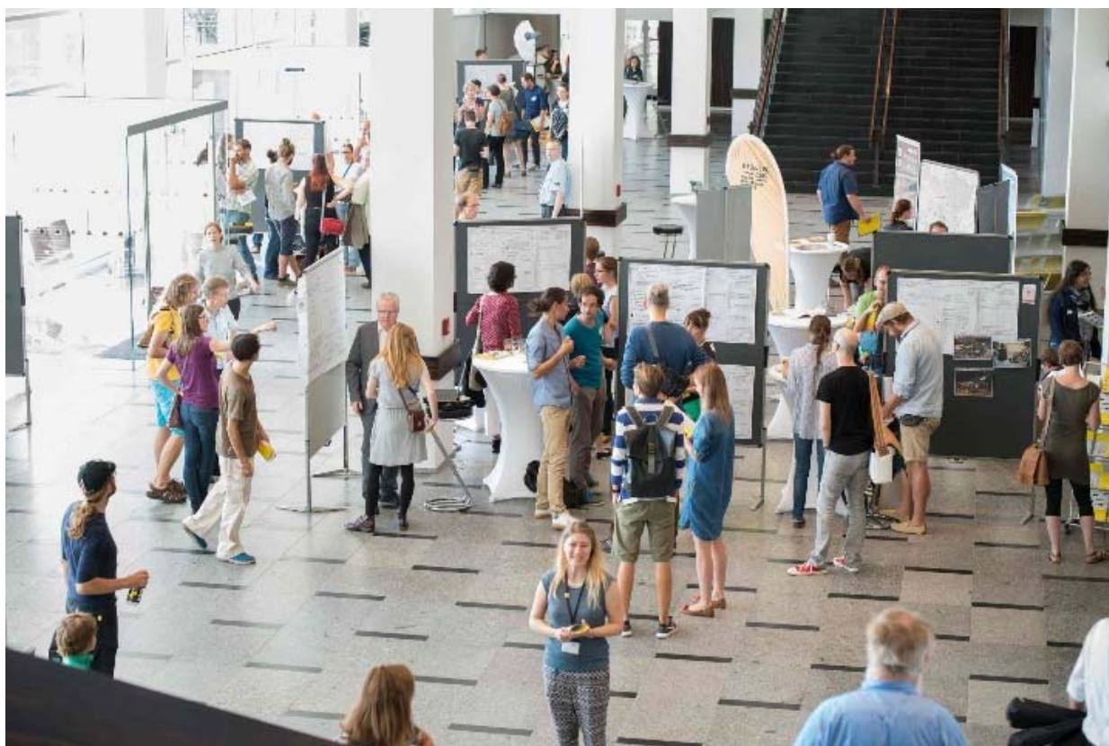
Abbildung 2: Zukunftskonferenz 2018: Bürgerprojekte vernetzen sich

Anders als in konsultierenden Beteiligungsverfahren hat dann allerdings nicht das Zukunftsstadt-Team als Prozessmanagement die Ideen aufgegriffen und bearbeitet. Vielmehr sind sie als Organisator/innen in den »Hebammen-Modus« gegangen: Ihr Auftrag war es, den Ideenträger/innen zu helfen, ihre Projektidee zu durchdenken, vorzuplanen und eine Umsetzungsreife zu erreichen. Durch eine Folge von Workshops sowie unterstützendes Arbeitsmaterial wurden die Bürger/innen in den entstehenden Bürgerprojektteams befähigt, aus ihren ersten Ideen handfeste Projektpläne zu machen. Diese Pläne wurden dann gemeinsam beim Bundesforschungsministerium zur Zukunftsstadt-Förderung eingereicht. Aktuell arbeiten in Dresden acht Bürgerteams (bezahlt und nicht nur ehrenamtlich!) an der Umsetzung nachhaltigkeitsrelevanter Zukunftsprojekte.